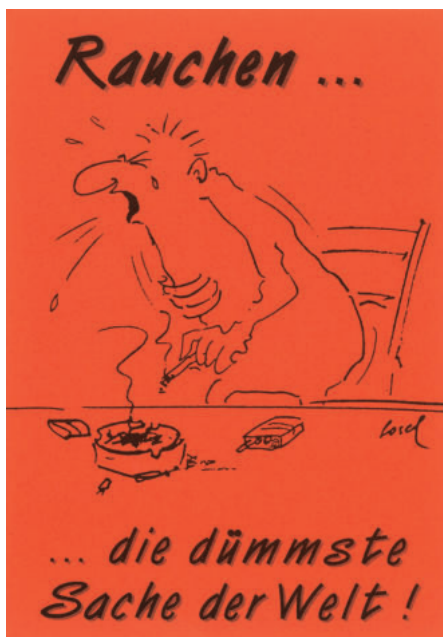
Papieraufkleber A/83, 7,5 x 10,5 cm, 0,40 €

Nur wenn die Politik endlich den Mut hat, das Raucherimage durch abwertende Äußerungen zu verändern, indem das Rauchen als Zeichen von Dummheit und nicht als cooler Trend der Zeit hingestellt wird, kann das Problem „Rauchen“ wirksam bekämpft werden. Rauchenden muss man ihre Unvernunft und ihr Fehlverhalten klar vor Augen führen. Die Raucherkosten von 10 Mrd. Euro/Jahr in Österreich müssen öffentlich bewusst gemacht werden!