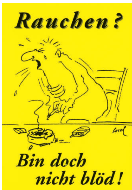
Papieraufkleber A/84, 7,5 x 10,5 cm, 0,40 €

Rauchende gehören zu den rücksichtslosesten Menschen (Ausnahmen bestätigen die Regel!). Sie rauchen ungeniert vor ihren eigenen Kindern und ebenso in Anwesenheit von Nichtrauchenden. Ihre Sucht rechtfertigt in keiner Weise ihr rücksichtsloses Verhalten. Hier schützt die Landesregierung mit einer falsch verstandenen Toleranz die Rauchenden, statt Nichtrauchenden den berechtigten Schutz vor dem Passivrauchen auf allen Ebenen zu garantieren. Die Begründungen der Landesregierung für den ungerechtfertigten Finanzstopp beweisen nur, dass sie von Nichtraucherschutz keine Ahnung hat!