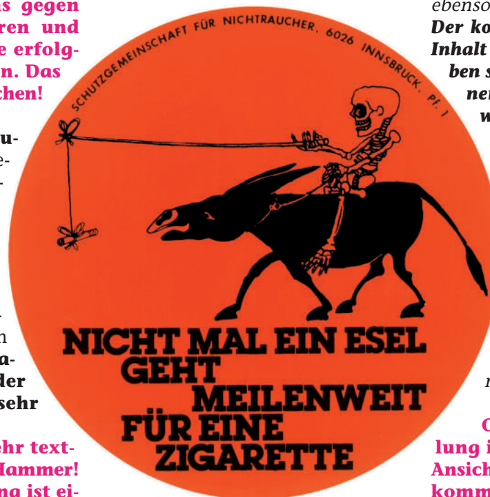
Aufkleber A/68, 9,5 cm Ø, 0,80 €

cher-Zeitung ist nicht in Frage zu stellen, sehr wohl aber die persönlichen Ansichten aus dem Büro von Landesrätin Hagele!