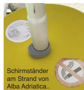
Schirmständer am Strand von Alba Adriatica..

Im Südosten von Italien gelten bereits seit 2019 in bestimmten Regionen Rauchverbote an den Stränden. In